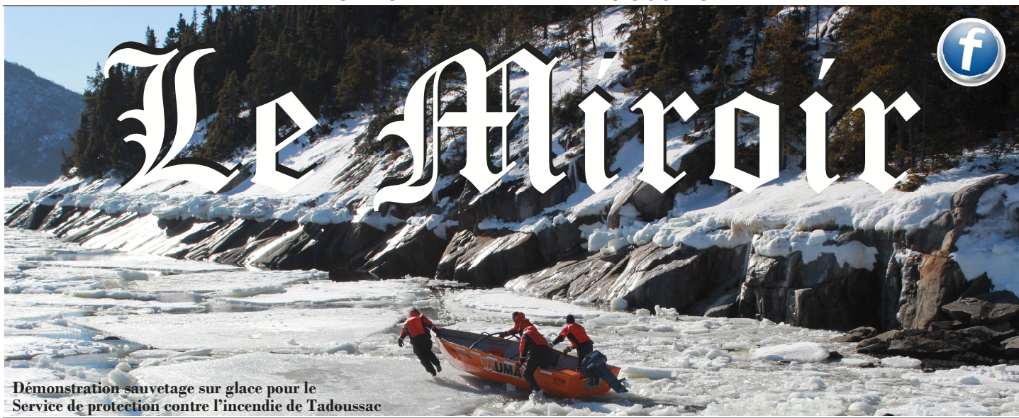
Démonstration sauvetage sur glace pour le Service de protection contre l'incendie de Tadoussac